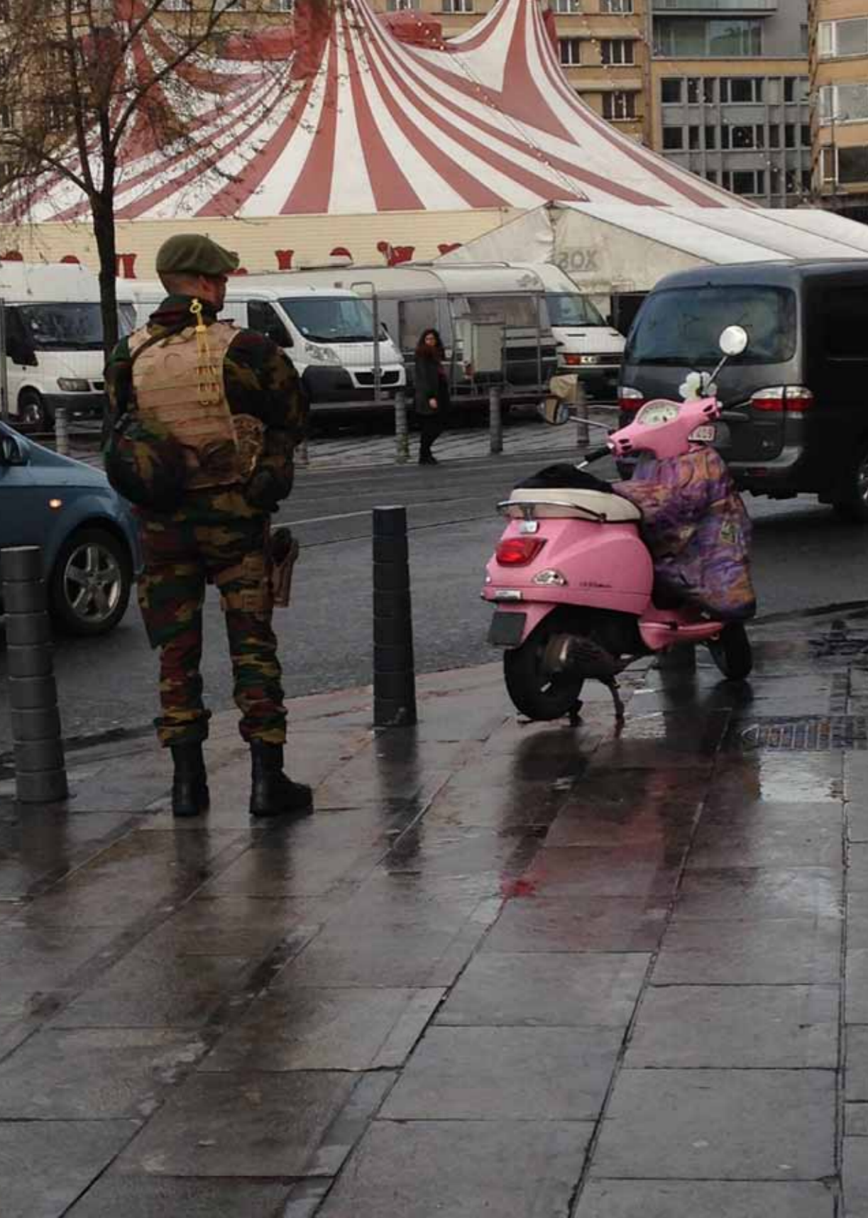
Place Eugène Flagey Brussel december 2015