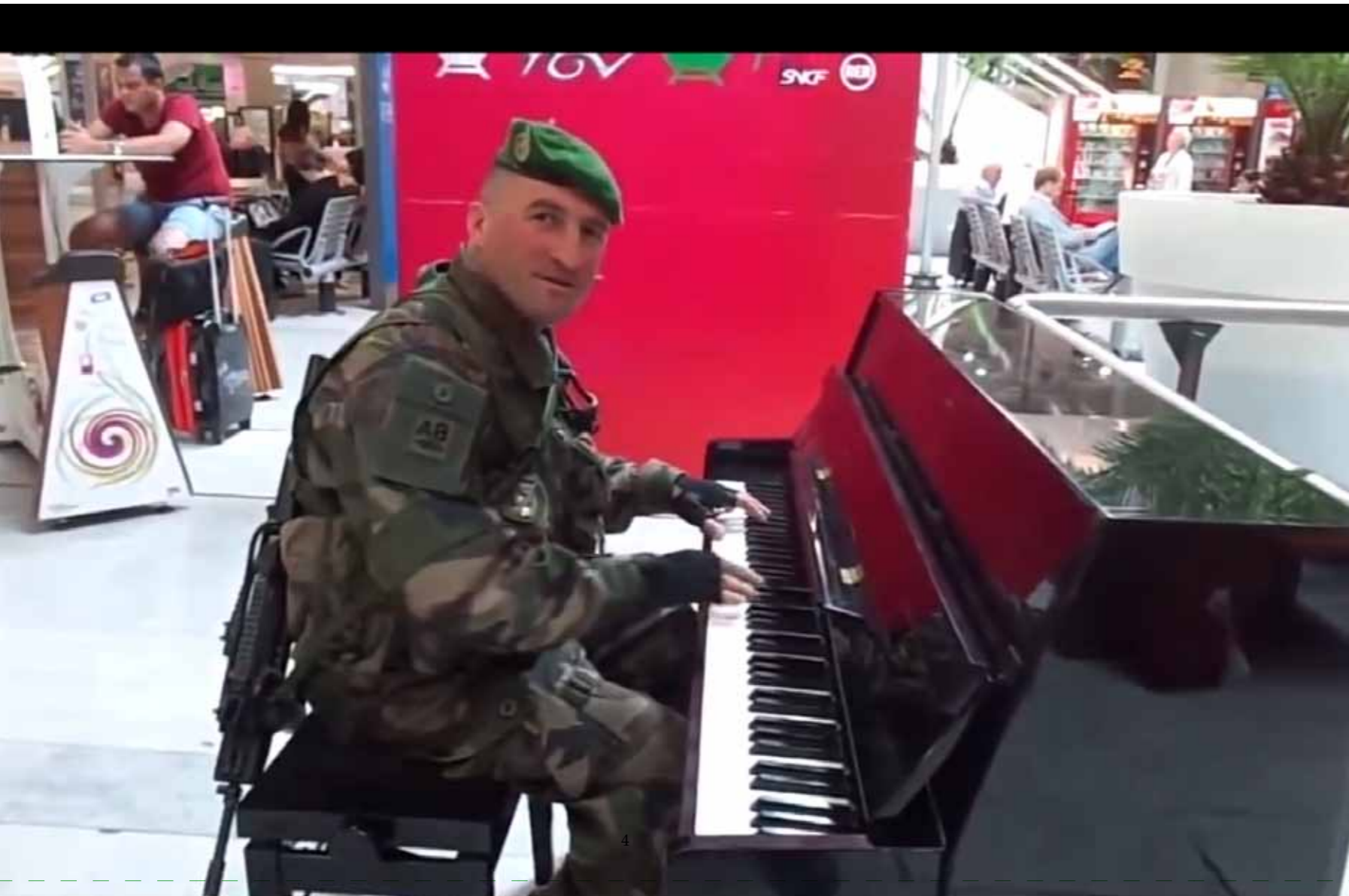
Georgian footballer plays piano and sings in Paris airport, 2015

Waar is vader? "Met hond lopen voor boom." 'Lopen voor boom', zo noemt Aisha dat; wandelen in het bos. Aisha is één van de vluchtelingen die mijn vader onder zijn hoede heeft genomen. Op de kast staat een plexiglazen blokje, vrijwilliger van het jaar, J.D. Kroneman. Het jaar weet ik niet meer.