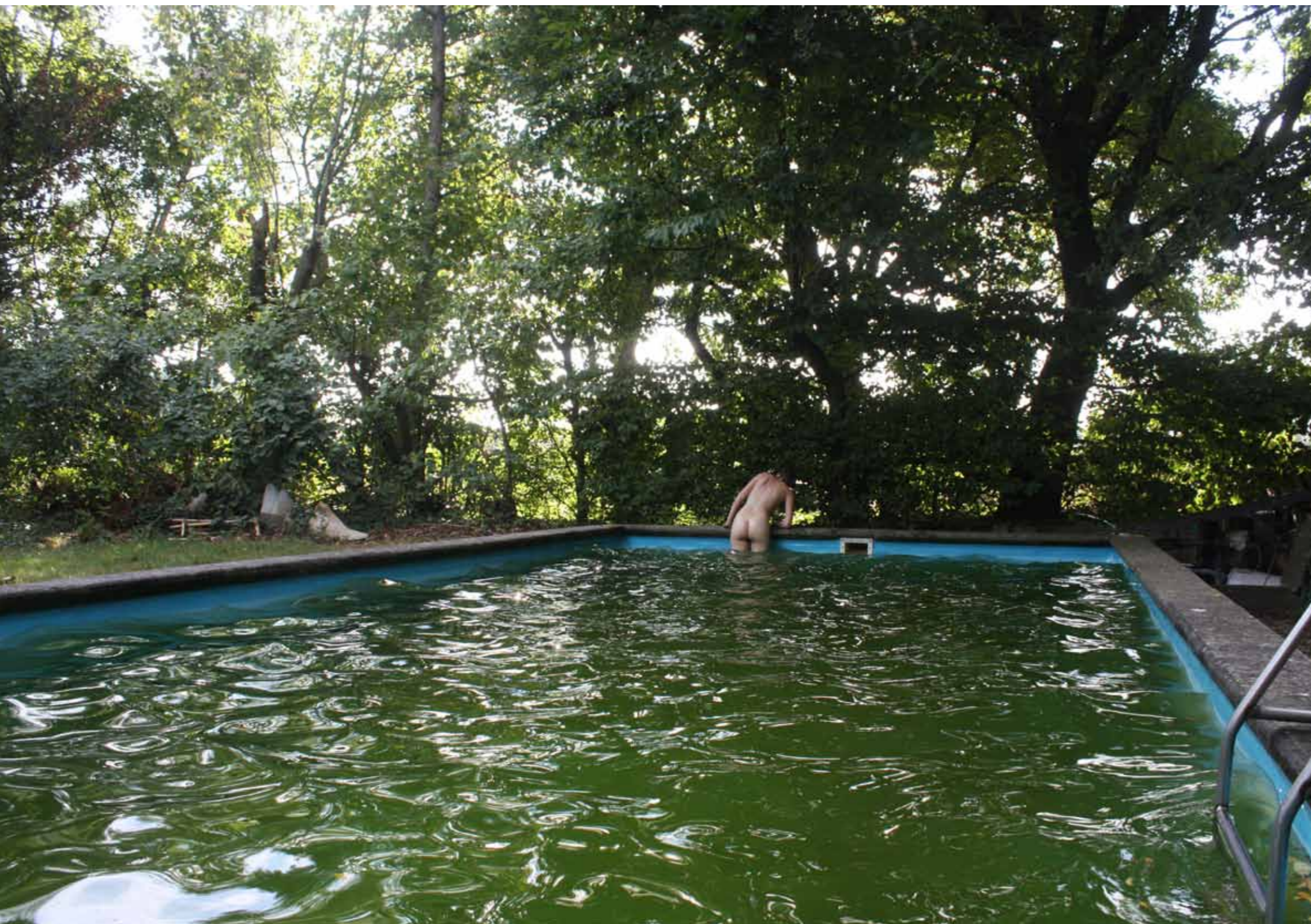
Het zwembad van mijn vader Karreveld 5 Heibloem 2015

We drinken koffie in 'De Thermiekbelt' op Terlet. Eefje neemt thee. Hoe spreken de zweefvlieg-liefhebbers hier af? Zeggen ze: "Ik zie je in De Bel?" Ik stel mij bij een thermiekbelt een transparante luchtbel voor met als rand iets zeepbelachtigs zoals zeepbelspecialisten die maken met een grote flexibele lus. Mijn vader had het vroeger ook al vaak over thermiek. Thermiek en zweefvliegen dat is twee handen op één buik.