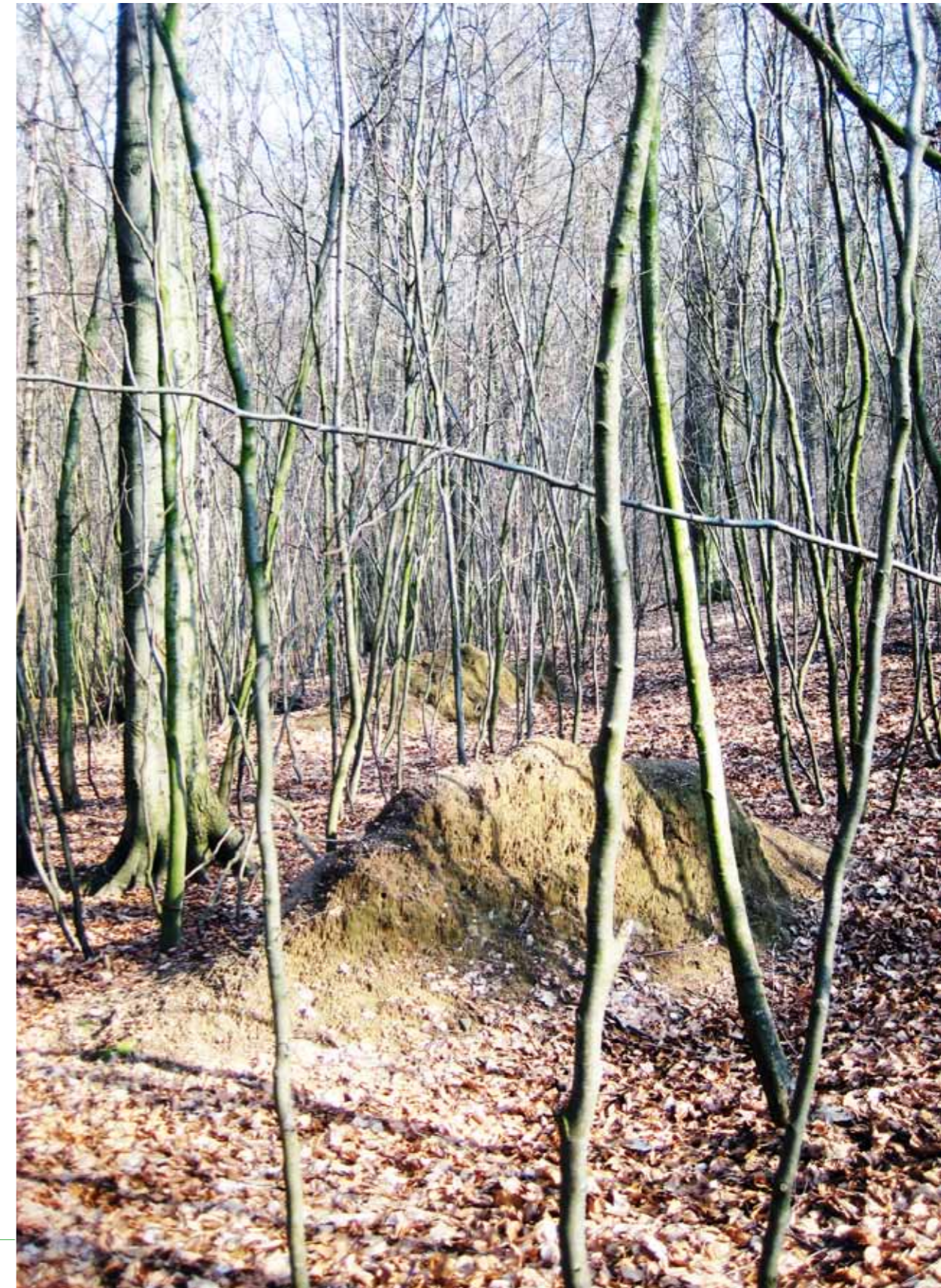
De Slanke Heuvels, Park Sonsbeek, Arnhem 2015

Ik ga naar café Tape, om mijn notities uit te werken. Spijbelen is het, ik moet eigenlijk aan mijn subsidieaanvraag werken. Die notities, losse woorden zijn het, hoelang weet ik nog wat ik daar toen mee bedoelde? Naar tape dus, met de fiets of lopen? Tape is dichtbij en als ik loop kan ik steeds bij die etalage op de Sonsbeek-singel naar binnen kijken, daar hangen blote meisjes. Met het verborgen landschap in mijn hoofd loop ik de etalage voorbij. Ik keer om, om mijn opzet waar te maken en omdat ik al van plan was dat daarna op te schrijven. In de etalage ligt glimmend bestek. Een vliegende kraai vangt altijd wat. Geen blote meisjes. Ik veins belangstelling voor het bestek. Links hangt wel een grote, artistiek grijzige foto van een vrouw met ontbloot bovenlichaam. Zij heeft haar armen over haar borsten gekruist. Teleurstellend. Achterin hangen kleine fotootjes maar die kan ik niet goed zien, ook niet omdat ik dat veinzen naar het bestek moet volhouden en dus niet onbeschaamd kan gaan staan turen.